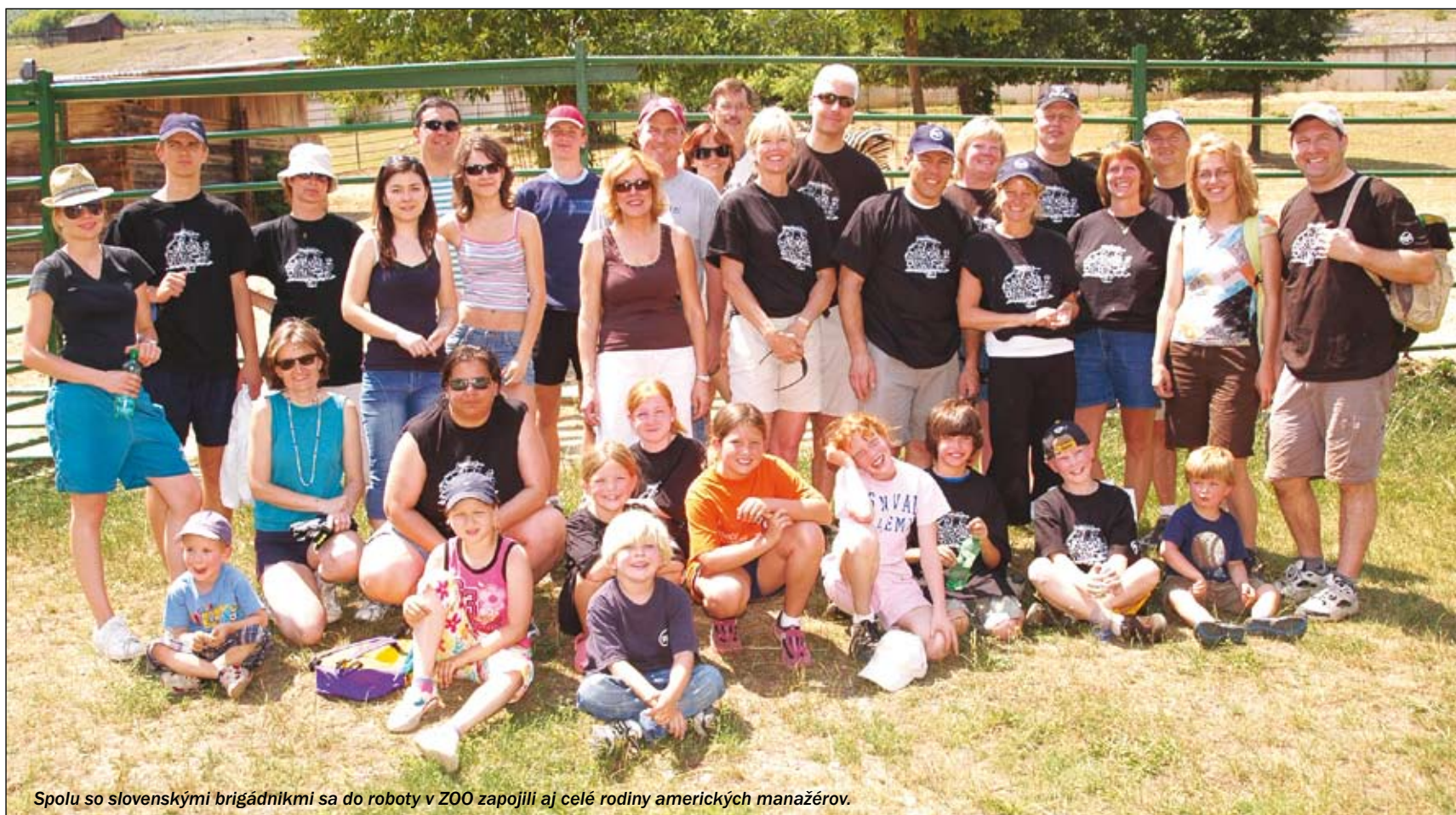
Spolu so slovenskými brigádnikmi sa do roboty v ZOO zapojili aj celé rodiny amerických manažérov.