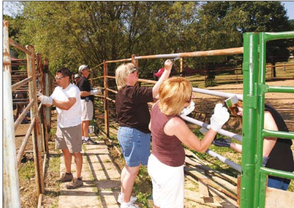
Krátko popoludní už boli výbehy pre zvieratka v novom šate.

Magdaléna FECURKOVÁ Foto: Jana ŠLOSÁROVÁ Milan KATUNSKÝ