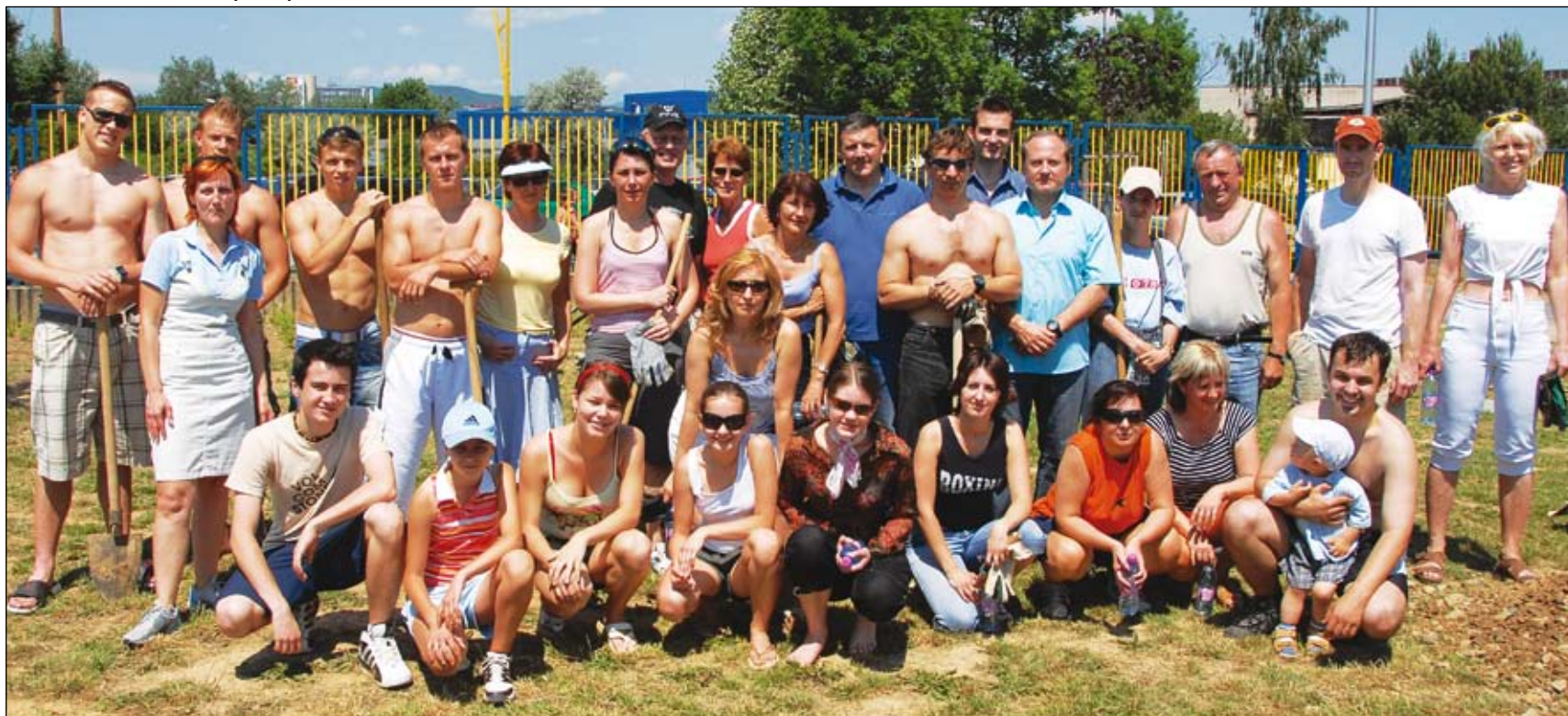
Spoločná fotografia na záver. Brigádnikov v Detskom športovom a zábavnom areáli na Alejovej ulici, väčšinu zamestnancov úseku Generálneho právneho zástupcu, prišli podporiť aj hokejisti HC Košice.

kus práce. A pri dobrom guláši sa našiel čas aj na kus reči.