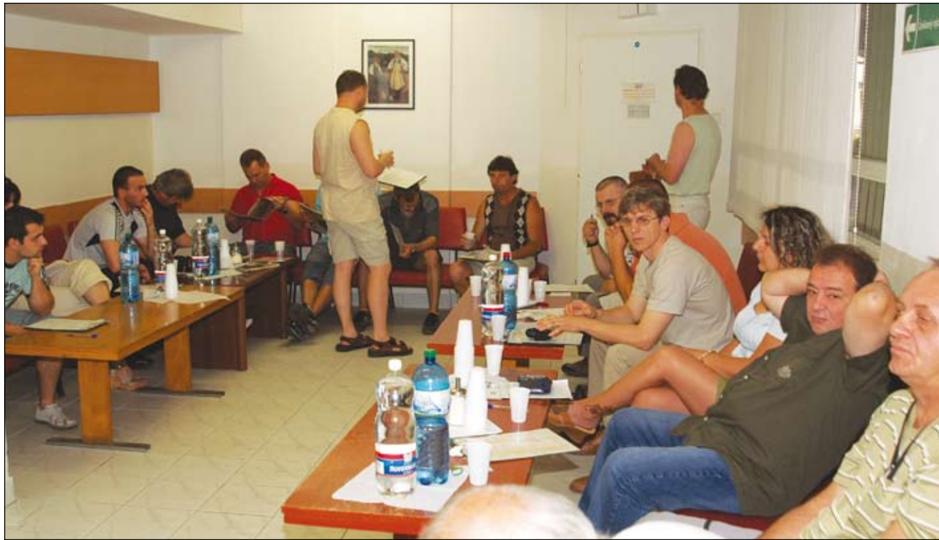
Čakáreň bola plná darcov krvi už o šiestej hodine ráno.

Piatok, 8. júna, šesť hodín ráno. Čakáreň Hematologicko-transfuziologického oddelenia polikliniky šačianskej nemocnice v areáli U. S. Steel Košice je plná. Do oficiálneho začiatku Hutníckej