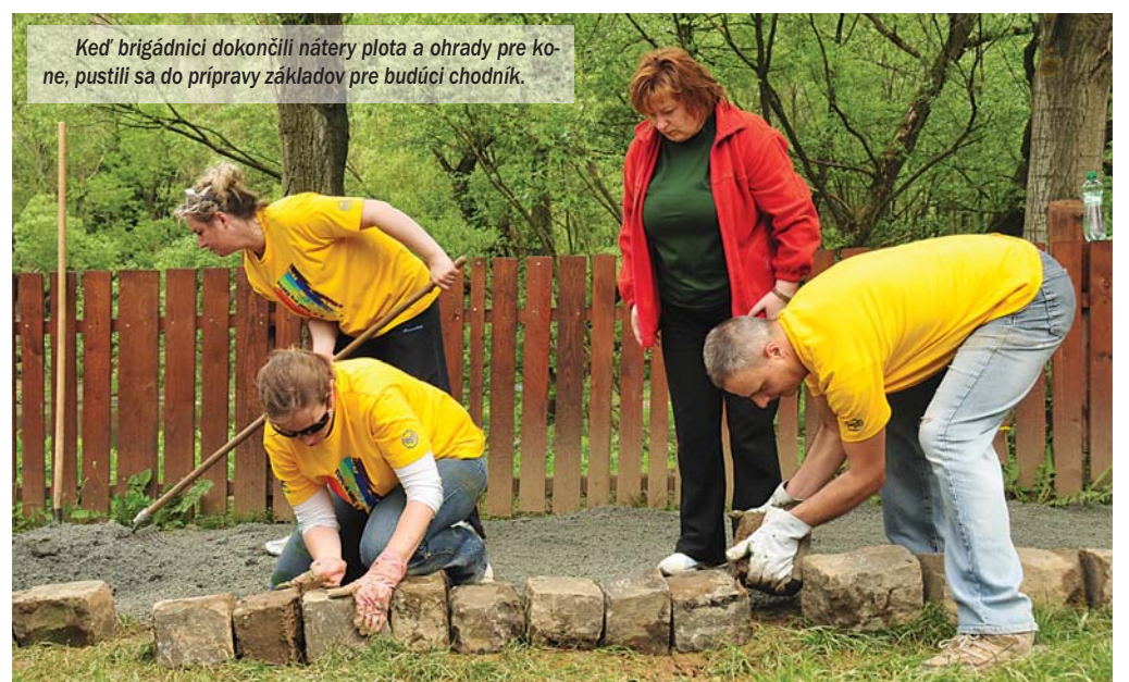
Keď brigádnicia dokončili nátory plota a ohrady pre kone, pustili sa do prípravy základov pre budúci chodník.