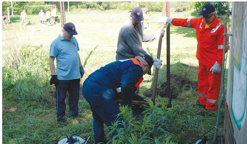
Skupina odborárov sa pustila do likvidácie nepotrebných oceľových konštrukcií.