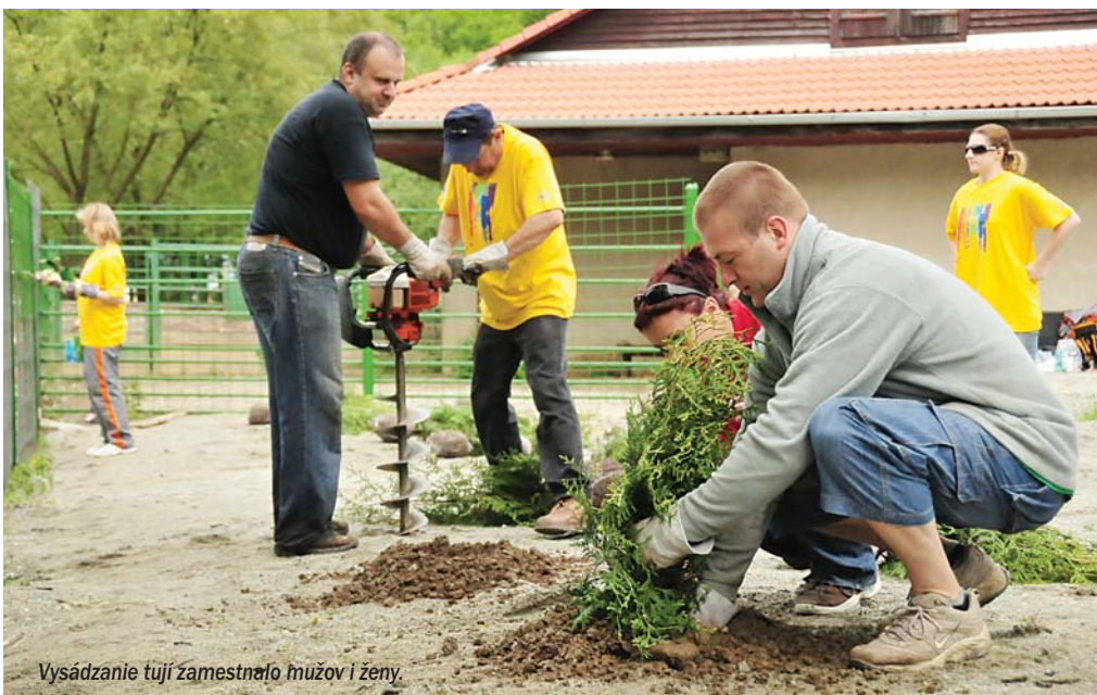
Vysádzanie tují zamestnalo mužov i ženy.

dújatia sa zúčastnili tiež prvý raz, ale ako svorne konštatovali, určite to nebolo naposledy.