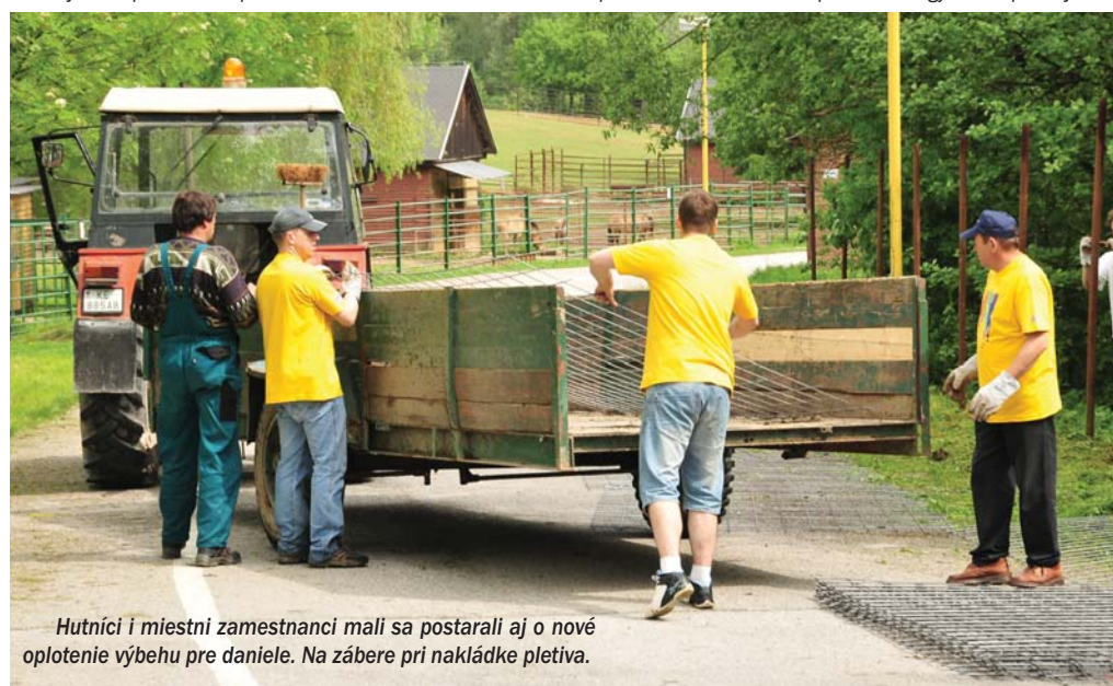
Hutníci i miestni zamestnanci mali sa postarať aj o nové optopenie výbehu pre daniele. Na zábere pri nakládke pletiva.