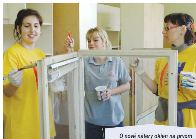
O nové nátery okien na prvom poschodí budovy, kde bude mať svoje priestory domov sociálnych služieb s denným stacionárom, sa postarali hlavne domáci - pedagógovia, rodičia a priatelia.