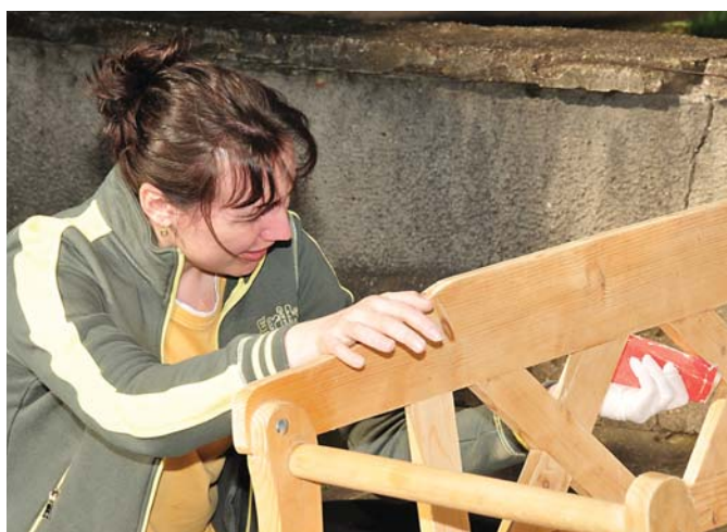
Na dobrovoľníckej sobote nechýbali ani učiteľky školy. Jedna z nich sa pustila do obnovy lavice.