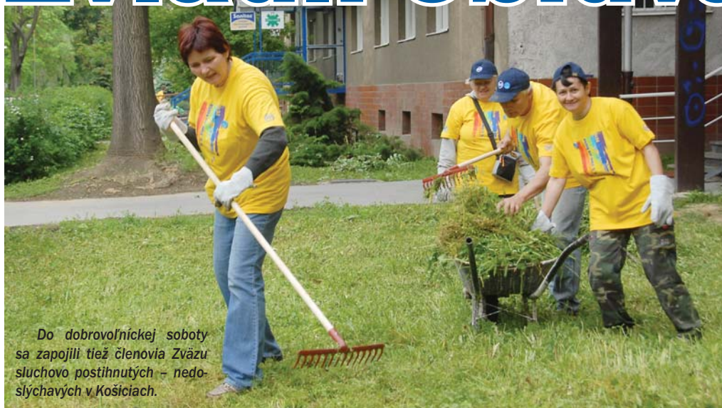
Do dobrovoľníckej soboty sa zapojili tiež členovia Zväzu sluchovo postihnutých – nedoslýchavých v Košiciach.