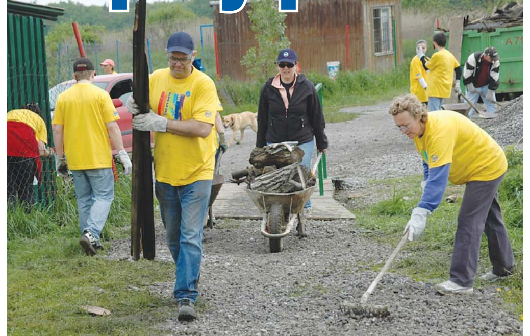
Práce bolo v útulku dosť. Pre silných chlapov i ženy...