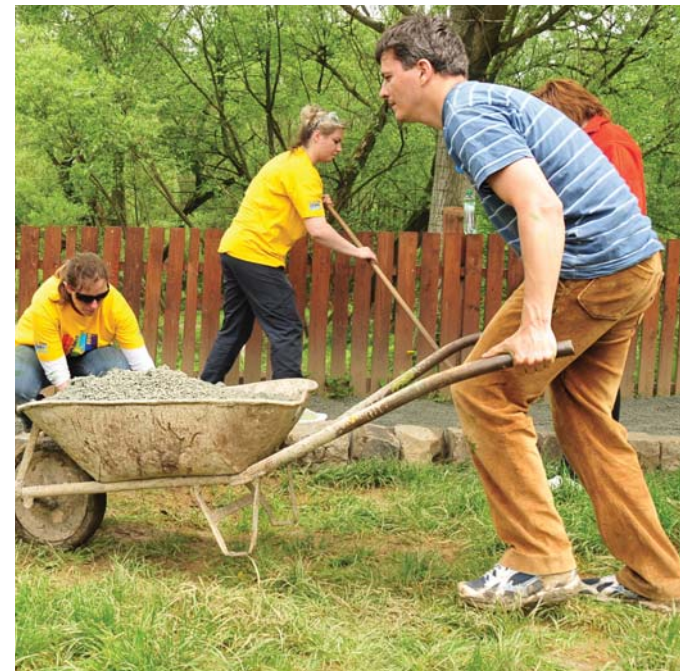
Fúrikovanie bolo doménu chlapov.