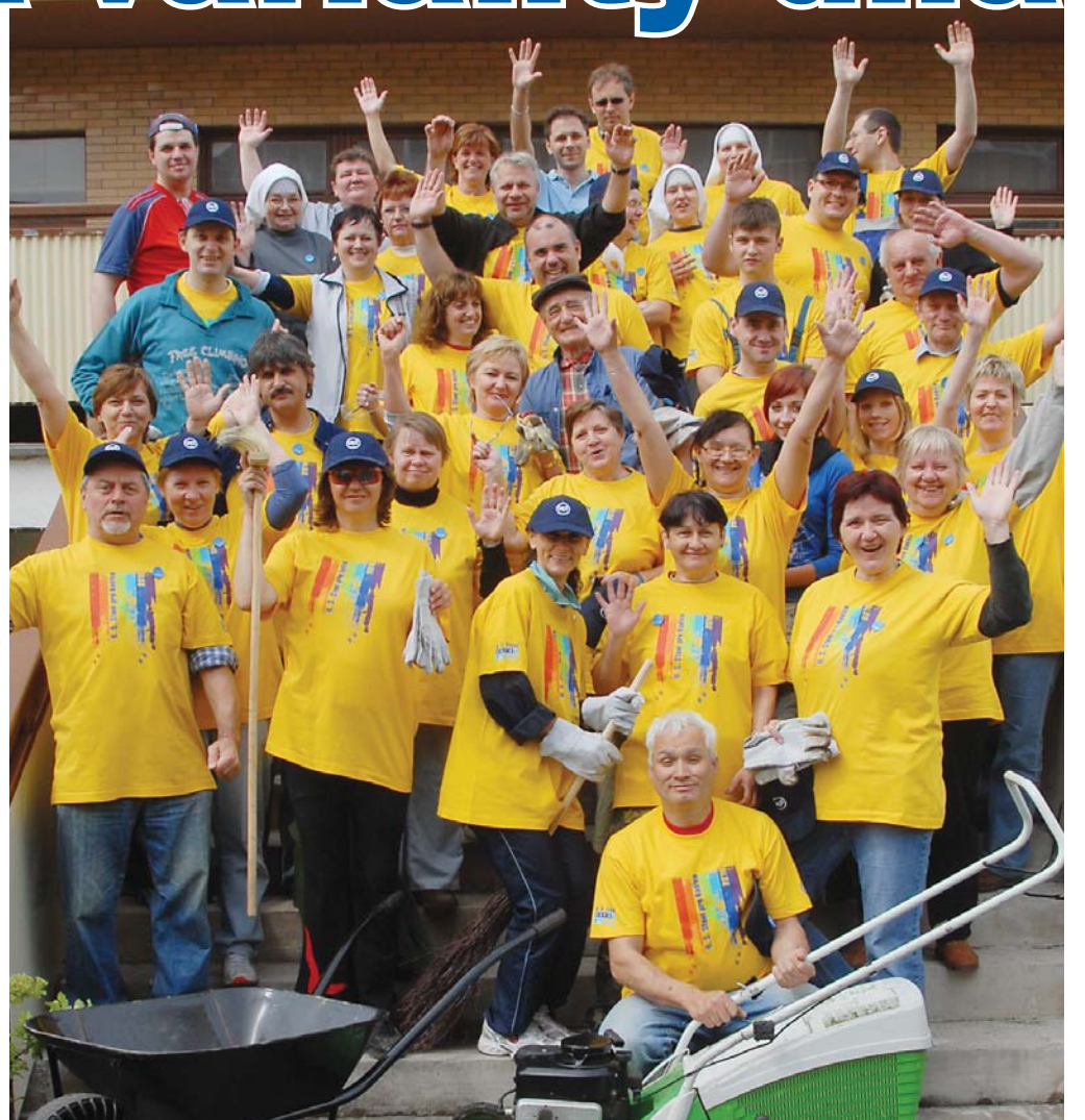
Dobrá nálada vydržala brigádnikom po celý deň. Zanechali po sebe kus práce.