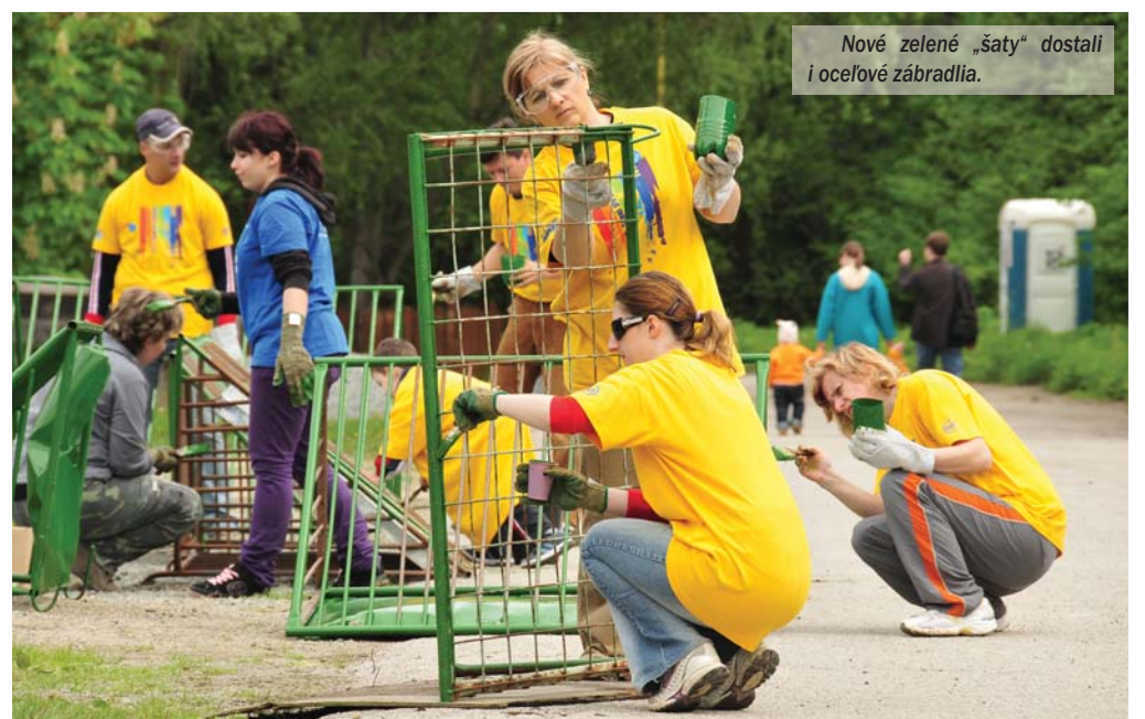
Nové zelené „šaty“ dostali i oceľové zábradlia.