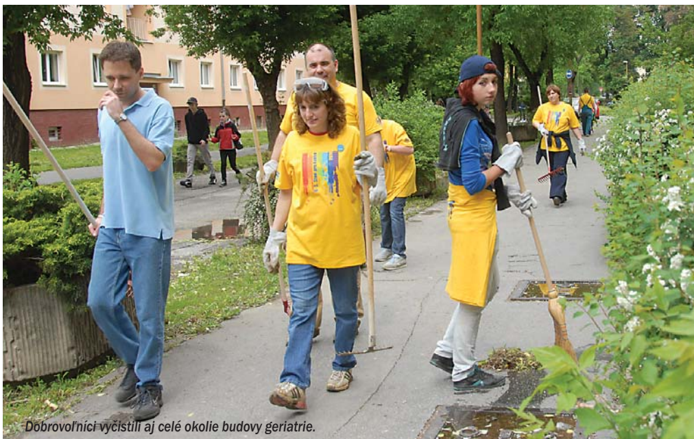
Dobrovoľníci vyčistili aj celé okolie budovy geriatrickej.

Vo Vysokošpecializovanom odbornom ústave geriatrickom sv. Lukáša v Košiciach si dobrovoľníci naozaj „švihli“. Ešte bolo iba čosi po desiatej hodine dopoludnia a takmer všetku robotu už mali za sebou. Prítom jej tu nebolo málo. Päťdesiatka ľudí – aktívni železiari, ale aj dôchodcovia, partia zo Zväzu sluchovo postihnutých (ZSP) – nedoslýchavých v Košiciach, ku ktorým sa už tradične pripojili aj zamestnanci geriatrickej, mali na sobotňajšie dopoludnie pripravené dve pracovné alternatívy – takzvaný mokrý i suchý plán. Hoci počasie dilemu vyriešilo – mohlo sa pracovať vo vonkajších priestoroch, nakoniec však stihli splniť plány oba. Vyčistiť