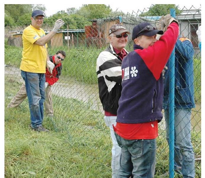
Partiu z úseku GM pre strategické suroviny sme zastihli pri montáži pletiva.