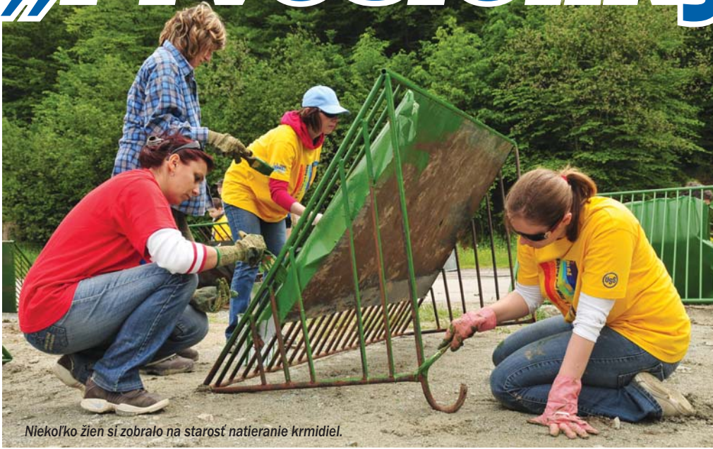
Niekoľko žien si zobralo na starosť natieranie krmidiel.

V košíckej zoológickej záhrade pracovali dobrovoľníci z radov hutníkov na štyroch miestach.