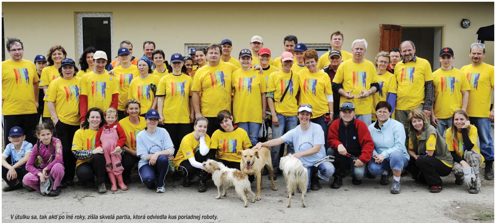
V útulku sa, tak ako po iné roky, zišla skvelá partia, ktorá odvieďa kus poriadnej roboty.