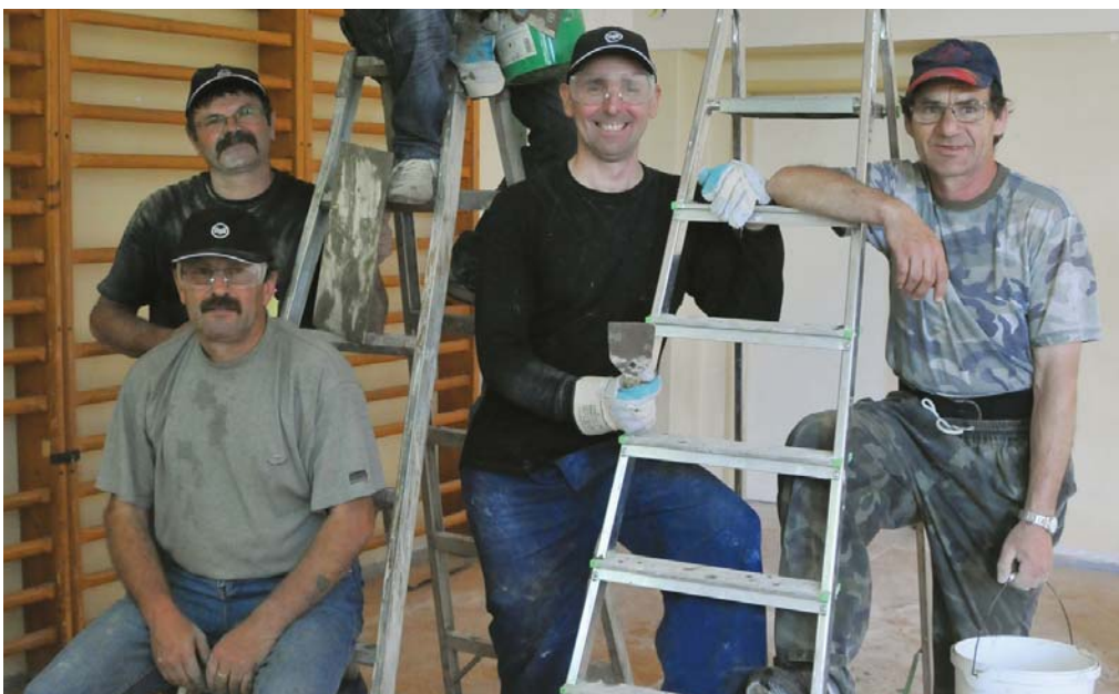
Partia v základnej škole dávala do poriadku cvičebňu.

Keď žaby veľmi krikajú a oslík hika, bude pršať, vraví jedna z ľudových pranostiek. Nuž, oslíka tím dobrovoľníkov v sobotu v Trstenom pri Hornáde v nádhernom prostredí revitalizované-