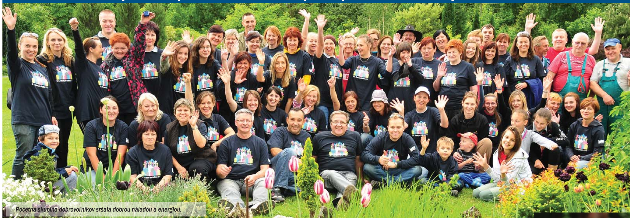
Početná skupina dobrovoľníkov sršala dobrou náladou a energiou.