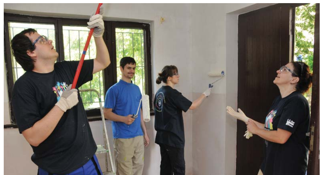
Vďaka brigádnikom sa zmenil na nepoznanie aj vnútrojšok školskej jedálne.