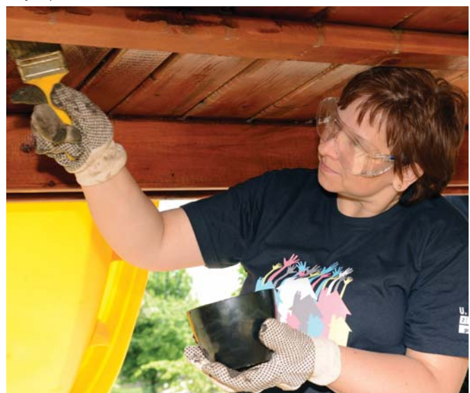
Maľovanie detských preliezačiek dalo dobrovoľníkom zabrat. Častokrát pracovali v stiesnených podmienkach.