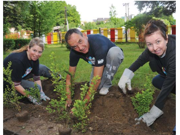
Jednou z aktivít bolo aj sadenie stromčekov.