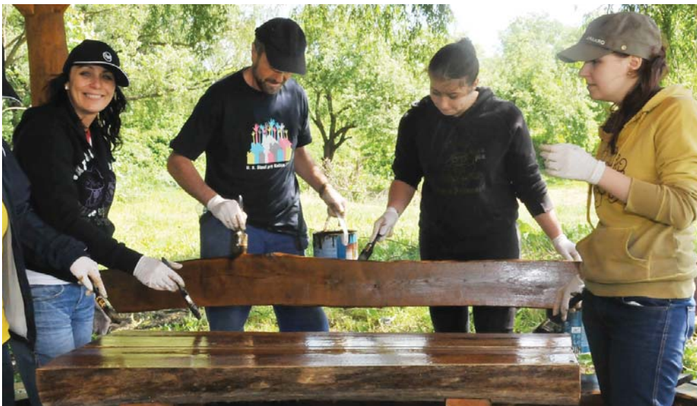
Skupinka dobrovoľníkov pri natieraní lavičky a stola pod jedným z altánkov.