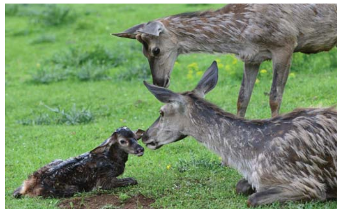
Nevšednou udalosťou bolo narodenie malého jelenčaťa.

S natieraním remízky pomáhala aj skupinka amerických kolegov, ku ktorej sa už druhý rok zaradili i vice-