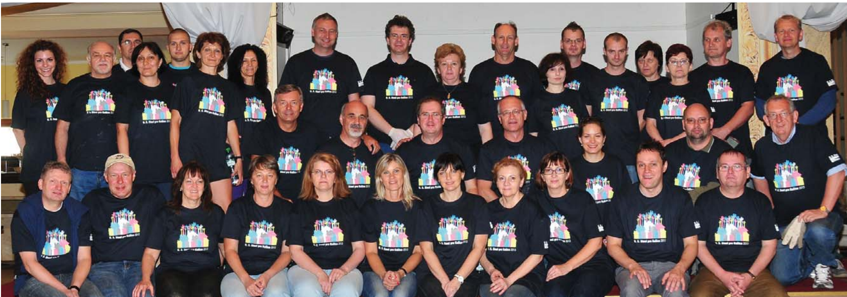
Dom umenia, ktorý má Štátna filharmonia Košice v prenájme, sa do programu dobrovoľníckych aktivít dostal v tomto roku po prvý raz. Početná skupina dobrovoľníkov si tunajšiu brigádu pochvalovala.