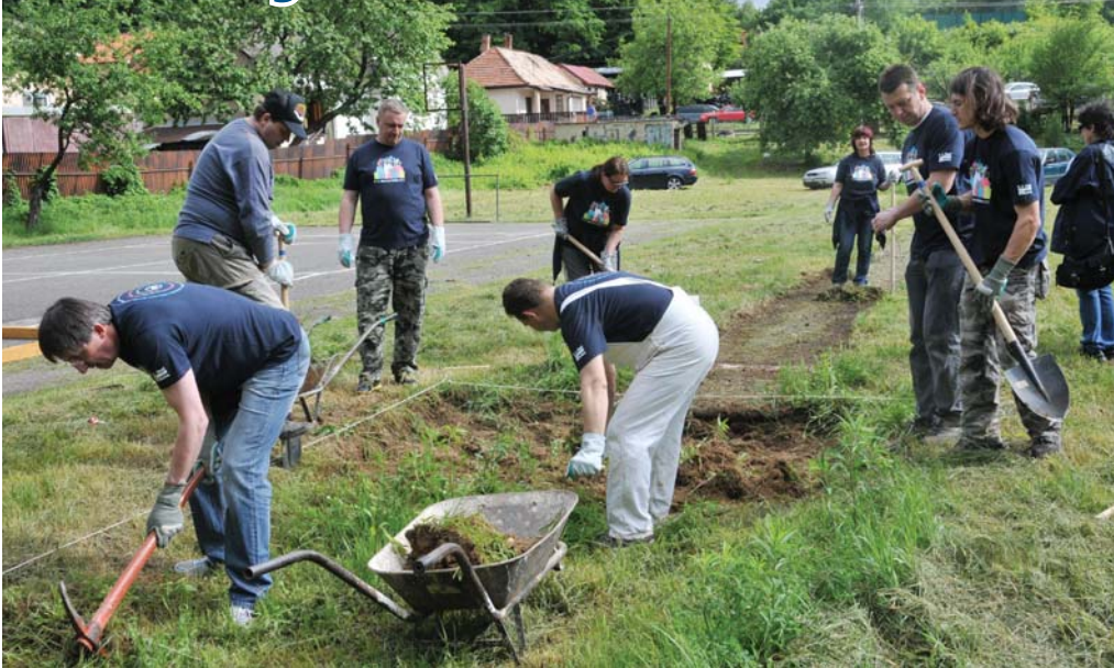
Na znovuvybudovaní doskočiska pracovala najpočetnejšia skupina.