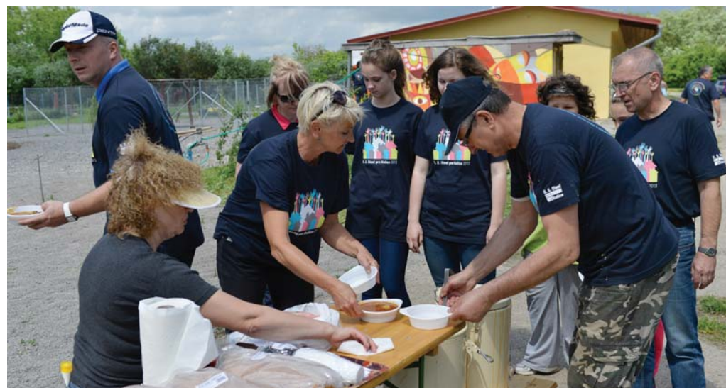
Dobrovoľníci si po práci pochutili na dobrom guláši.