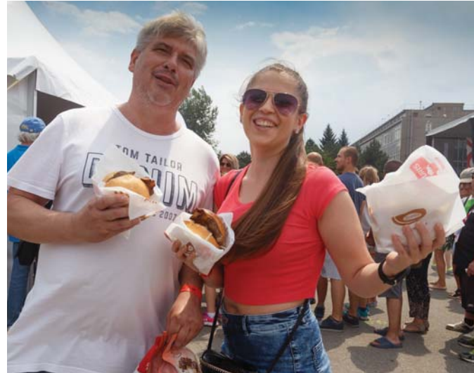
Laci pečené od prezidenta chutí výborne! Potvrdil Pavol Varga.