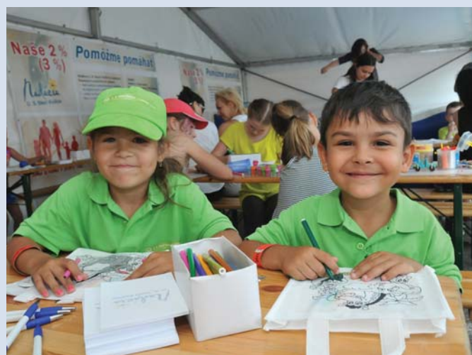
Najobľúbenejšou aktivitou bola nesporne výroba peknej farebnej tašky.

s animátorkami a firemnými štipendistkami, ktoré prišli s aktivitami pre deti pomôcť, sa takmer počas celého dňa nezastavili, no pre každého záujemcu o ručné a tvorivé dielne pripravili kopec aktivít. A čo bolo nesporne motivujúce, autori si svoje vlastnoručne vyro-