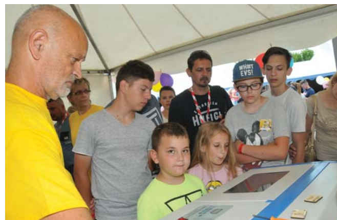
Vďaka gravírovaciemu stroju si mnohí železiari či ich blízki odniesli domov na pamiatku napríklad kľúčenkú podľa vlastného návrhu.