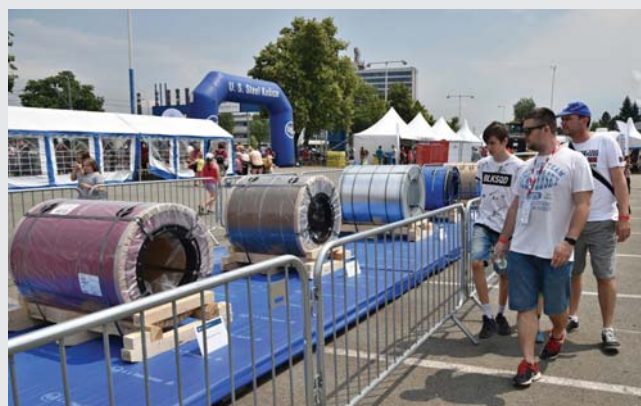
O výrobky vystavené na stredovej ploche bol takisto veľký záujem, obchodníci ich predviedli celú paletu, od brám a zvitkov až po karosériu automobilu.