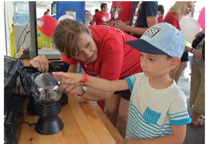
Zvedavosť budila plazmová lampa.

Plno bolo pri esbeeskároch, ktorí zvedavcom, a tých bolo veru viac než dosť, poukazovali prístroje a pomôcky používané pri výkone strážnej služby. A čo viac, každý si ich mohol aj oprobovať. Všakovaké zábavné aktivity a ma-