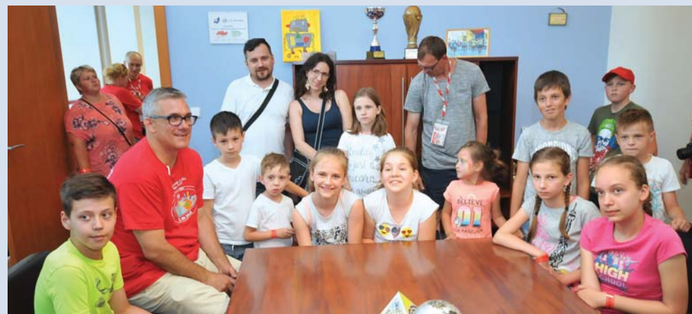
Časť hostí sa už usadila, prídu ešte ďalší...