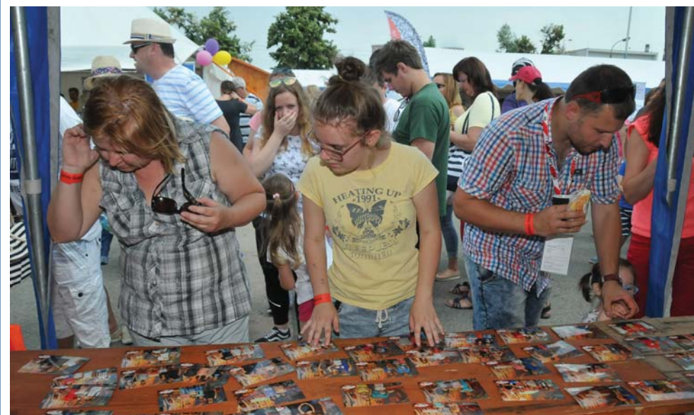
Snímky boli hotové do pol hodiny, stačilo si po nich prísť.

mi plechov. Výroba netrvala dlho, po pol hodine sa mohol každý zastaviť pri stole s rozloženými fotografiami a vybrať si tú svoju. Partneri vo fotokútiku ich vyrobili v priebehu dňa niekoľko stoviek.