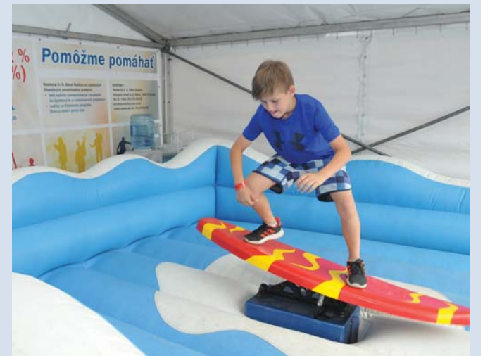
Simulátor surfu lákal chlapcov i dievčatá.