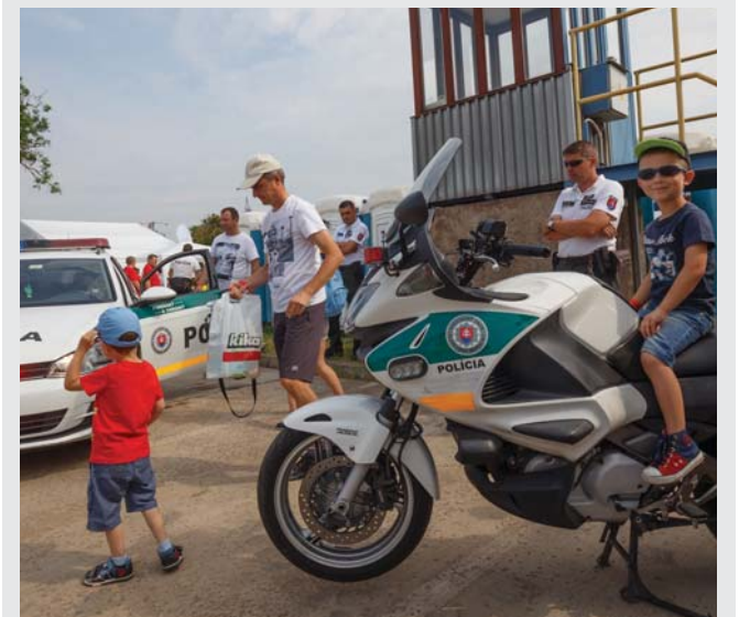
Blikajúce majúky policajného auta a motorky lákali malých i veľkých.