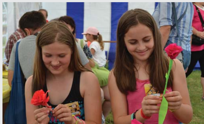
Kto rýchlejšie uvije papierovú ružu?

Papierová ruža vystretaná v maringotke pri kolotočoch symbolizuje prchavosť času, ale aj radosť z príjemne prežitého okamihu. To všetko sa dalo nájsť v kreatívnom stane, ktorý na zelenej lúke ponúkal tvorivú radosť. Deti maľovali, strihali, zakrúcali papiero-