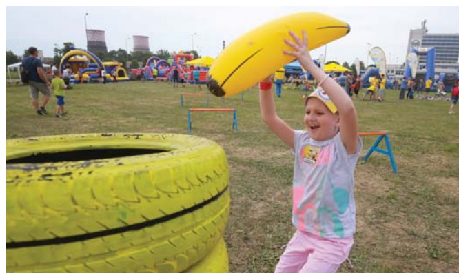
Už len jeden banán a ďalšia mimoňovská úloha je splnená!

žltým postavičkám milujúcim banány. Mimoňské atrakcie zaplavili podstatnú časť lúky pred areálom U. S. Steel Košice a okrem viacerých nafukovacích