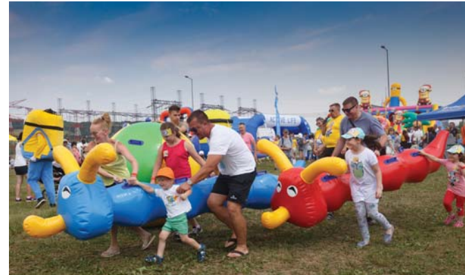
Práve o tomto má byť Family Safety Day - celá rodina si užíva spoločnú zábavu.

O čosi staršie deti príťahovala skôr veľká nafukovacia prekážková dráha, ktorá vyrástla po celej dĺžke lúky. „Paráda, v telke stále pozerám Ninja Factor a teraz som si to konečne