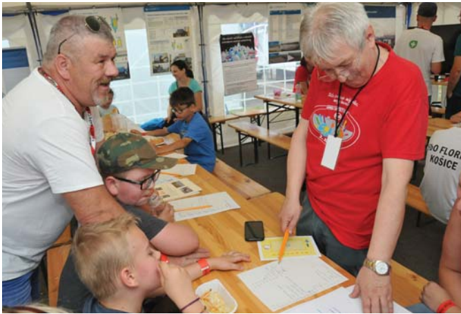
Niektoré z vedomostných testov dali zabráť.

Nuž, nášho kolegu, ktorý priniesol vzorku vody zo svojej studne na rozbor do stanu environmentu hneď zrána, výsledok, aj keď len orientačný, určite nepotešil. Bodaj by aj. S obsahom 205 miligramov dusičnanov na liter nie je vôbec vhodná na pitie a aj