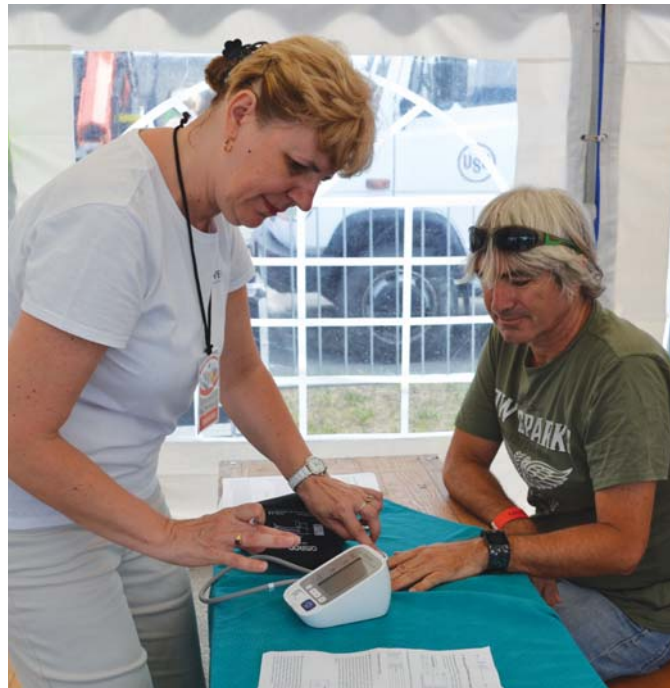
Dobrý tlak – úsmev na tvári.

o telo. Všetko je tak, ako má byť. Nuž, krajší začiatok dňa som si ani nemohla predstaviť! Ako dobre, že som si zónu