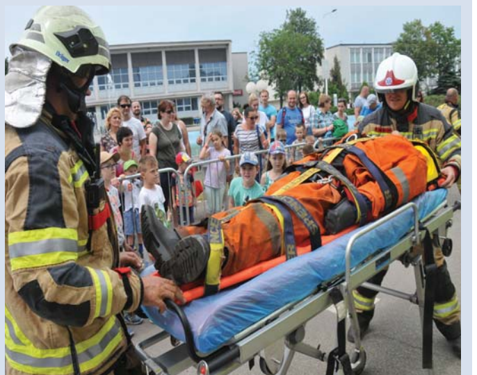
Všetko dopadlo dobre, pacient je stabilizovaný.

Podobné cvičenia sú podľa neho mimoriadne potrebné a výrazne skvalitňujú následné ostré zásahy, ktorých už absolvoval závodný hasičský útvar košickej oceliarni v minulosti niekoľko. O tom, ako na to a akú techniku pri tom chlapi využívajú, sa mohli účastníci podujatia dozvedieť na prezentácii hasičskej výstroja a výstroja na parkovisku.