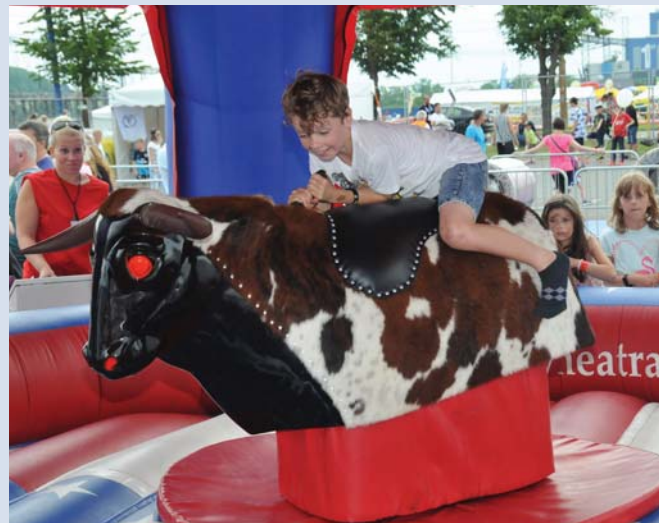
Ako dlho by ste sa udržali na chrbte tohto býka?