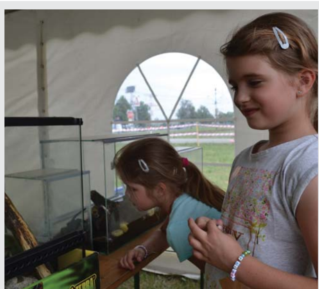
Na chlpateho vtáčikara sa najlepšie pozerať cez sklo...